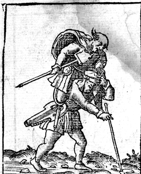
Andrea Alciato: Emblematum libellus , Paris: Chrestien Wechel, 1534, p. 26.

«El ciego lleuaua a cuestras al coxo, y el coxo yua diziendo al ciego por donde auia de yr», explicaba en otra edición Diego López 29 . Considerando que en la tradición hispánica hay un cojo que además es diablo, la semejanza con el módulo del pliego de aleruyas da que pensar y obliga a preguntarse si la filacteria «dónde me llevas pícaro» no debería leerse como una ruptura del pacto de confianza que une naturalmente a ambos personajes. Estos indicios, si bien pocos y frágiles, invitan a creer que ciego, pícaro y diablo constituyeron tradicionalmente una sociedad de auxilios mutuos, relevándose por turnos en sus funciones.