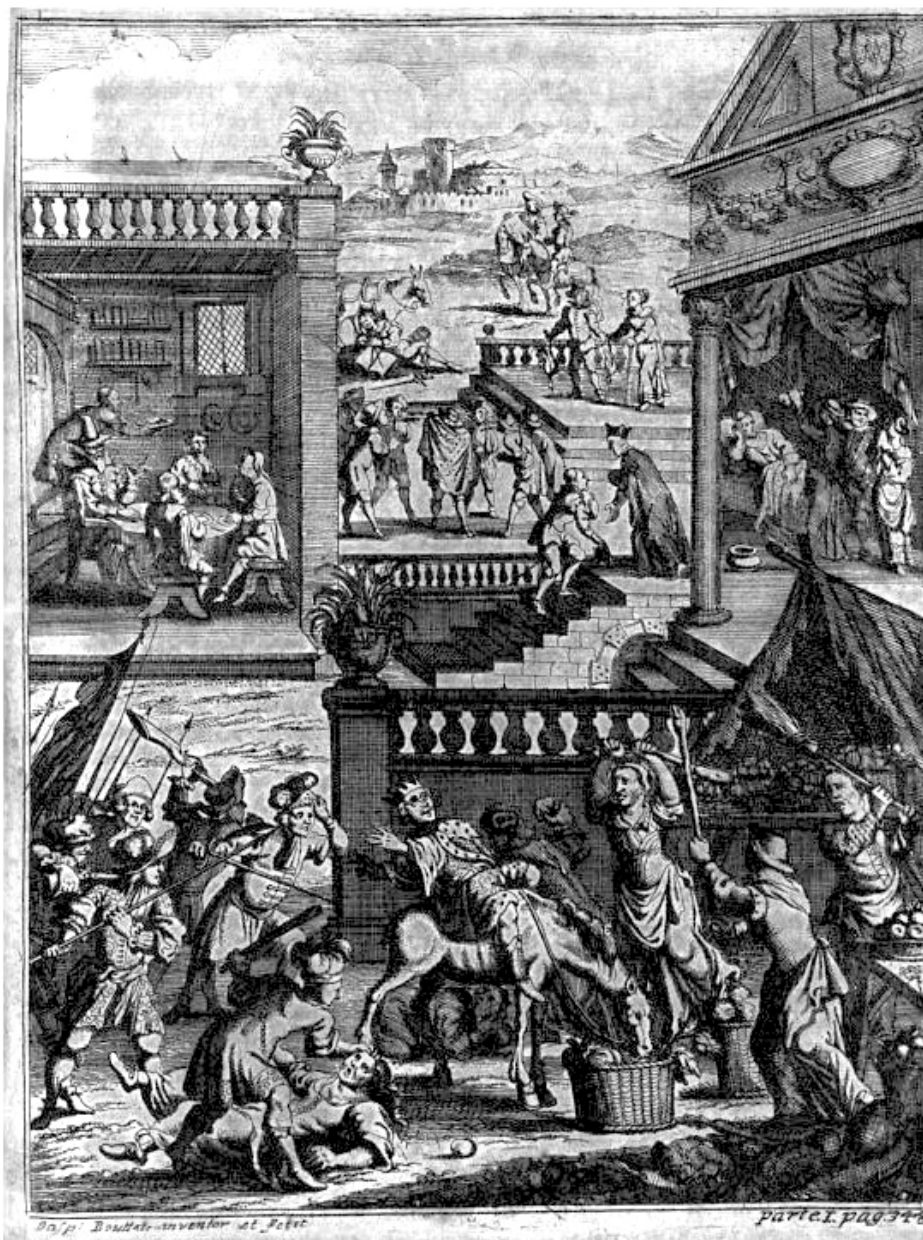
Grabado de Gaspar Bouttats en Obras de don Francisco de Quevedo Villegas , Amberes: Henrico & Cornelio Verdussen, 1699, entre las páginas 378 y 379.